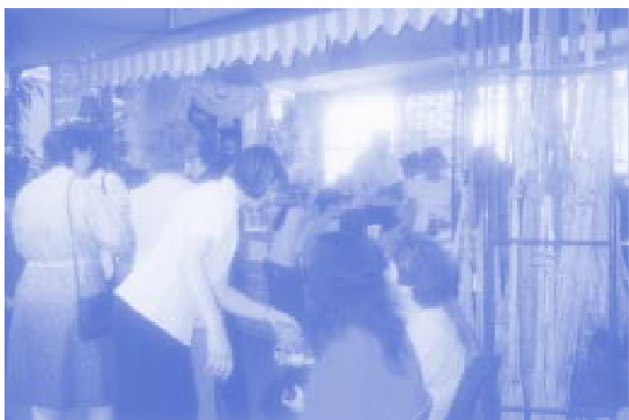
Attività ta' nofs ta' nhar għall-familji tal-membri fi stabiliment tal-pjanti (Mejju 2002)