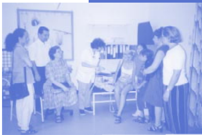
Membri tas-Socjeta' fl-Occupational Therapy Unit fl-isptar San Luqa