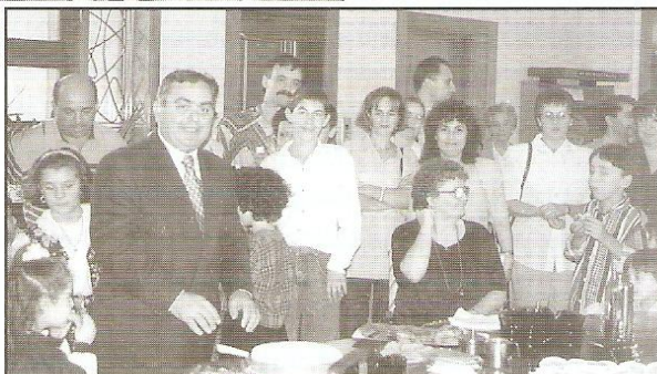
Il-President tas-Socjetà jaqsam il-kejk waqt il-Festin li sar wara.